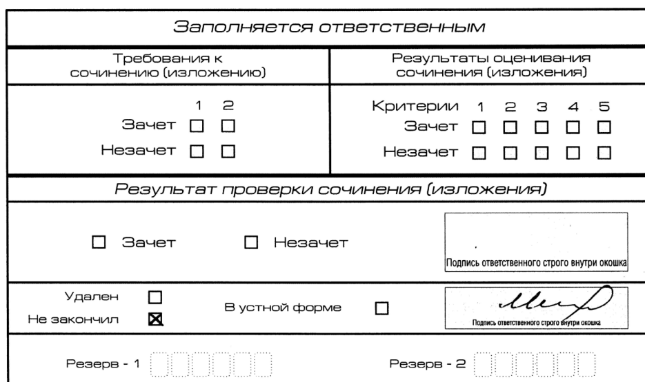
Рис. 12. Заполнение полей нижней части бланка регистрации (завершение написания сочинения (изложения) по уважительным причинам)